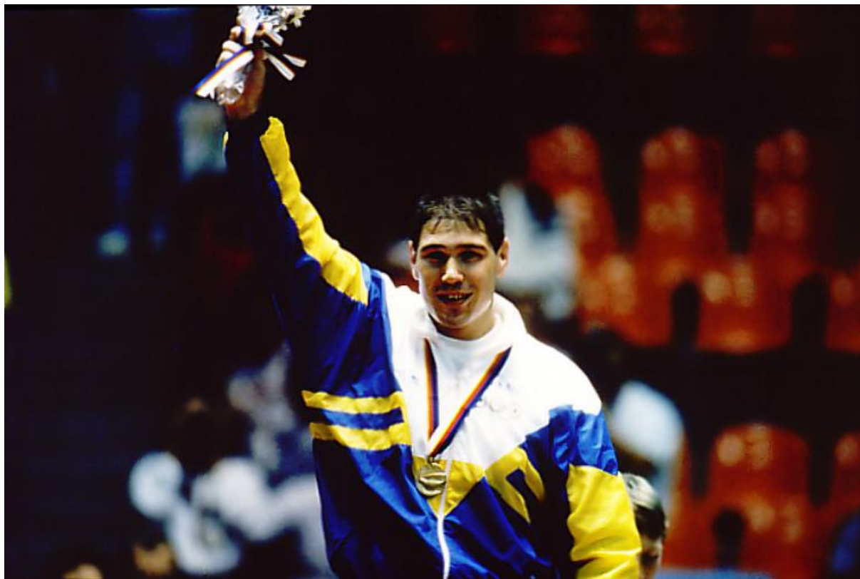
Aurélio Miguel – Ouro em Seul 88