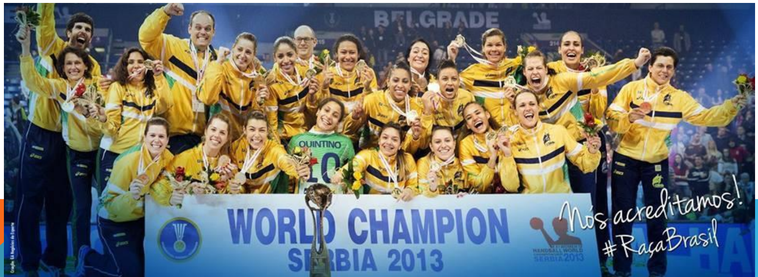
Atletas no Congresso / Handebol Feminino Campeão Mundial