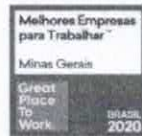
Great Place to Work® - Minas Gerais 2020 Melhores Empresas para Trabalhar em Minas Gerais