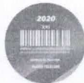
XXI Prêmio Consumidor Moderno de Excelência em Serviços ao Cliente Categorias: Telecomunicações; Telefonia Fixa e Telecomunicações; Telefonia Móvel