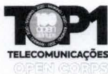
Prêmio TOP Open Corps 2020 A Telecom mais aberta ao ecossistema de inovação